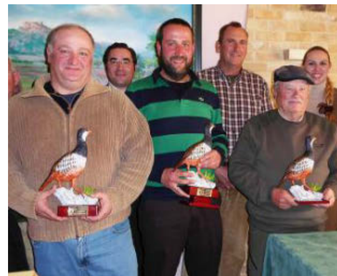
Un momento de la entrega de premios.